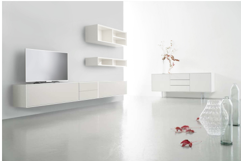
Erweiterte Kollektion: Komplette Ess- und Wohnzimmer-Ausstattungen nun im Programm

gestapelt, gehängt oder gestellt werden, ob auf Füßen oder ganz ohne - die Gestaltungsmöglichkeiten für Game sind schier grenzenlos. ■