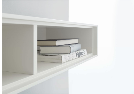
Handwerkliche Meisterarbeit: Der Korpus mit seinem feinen Rahmen und der nach innen versetzten Stufe