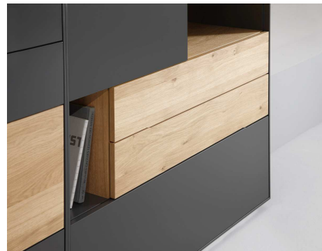
Formen, Farben, Holzarten: Zahlreiche Varianten stehen zur Auswahl

Abdruck frei. Bei redaktioneller Verwendung bitten wir um die Zusendung zweier Belegexemplare an: