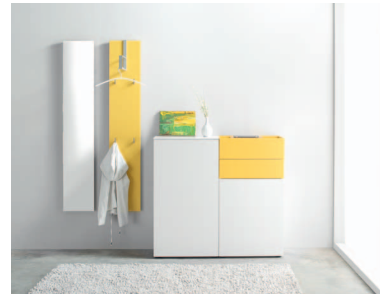
▲ TED 14 | B ca. 200 x H 201 x T 35 cm, Glattlack Blütenweiß, Glattlack superlemon TED 14 | W approx. 200 x H 201 x D 35 cm, Blossom white smooth lacquer, superlemon smooth lacquer