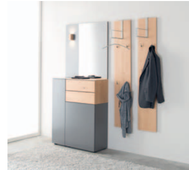
► TED 15 B ca. 200 x H 201 x T 35 cm, Glattlack onyxgrau, Ethno Eiche TED 15 W approx. 200 x H 201 x D 35 cm Onyxgrey smooth lacquer, ethno oak

The TED programme can be combined in different ways with various modules. Its body has a drawer unit that can stand as a laterally mounted monolith. Optionally it can be replaced by a storage box with a USB loading station.