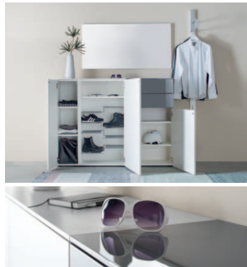
▲ Ablageschale mit Schiebeplatte und USB-Aufladestation. Storage tray with sliding plate and USB charging station.