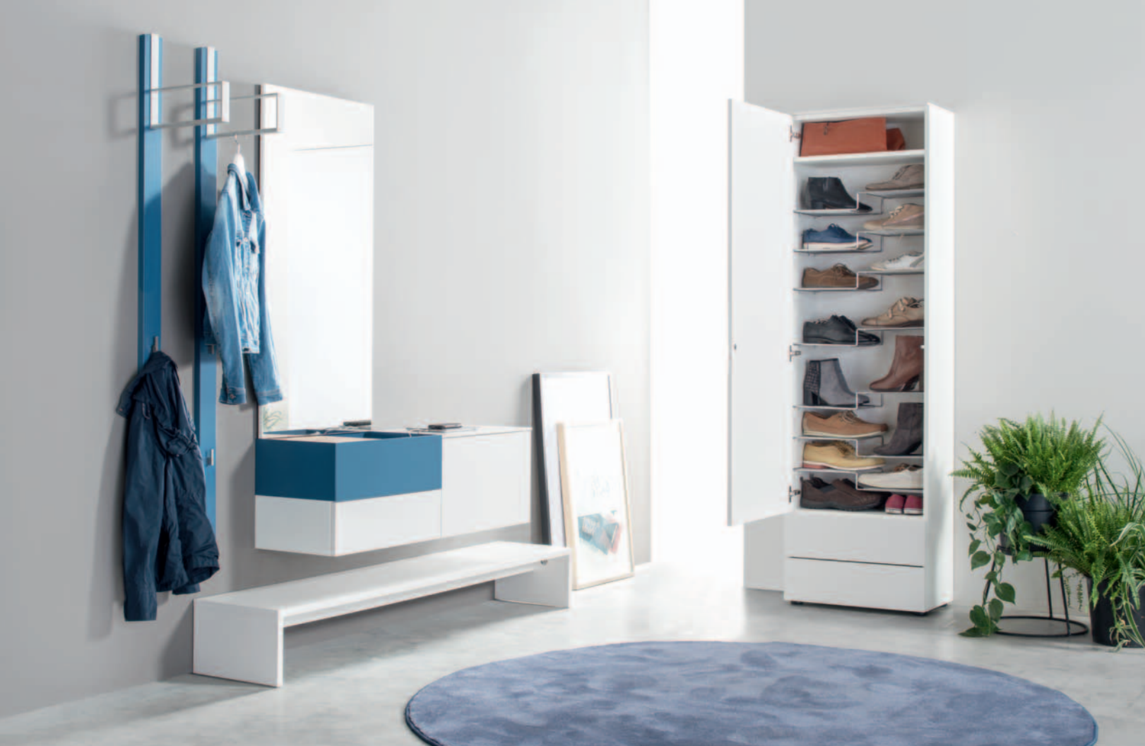
▲ TED 13 | B ca. 200 x H 201 x T 35 cm, Glattlack terra, Hochglanzlack pacificblau TED 13 | W approx. 200 x H 201 x D 35 cm Terra smooth lacquer, pacificblue high gloss lacquer