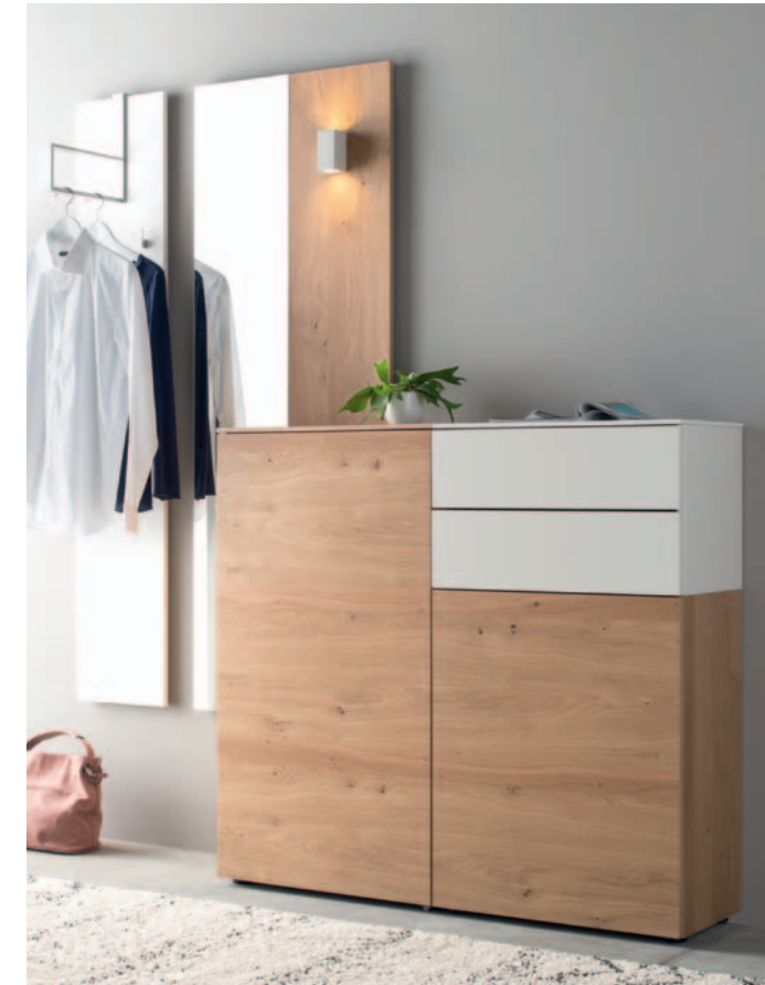
► TED 9 | B ca. 250 x H 201 x T 35 cm, Glattlack Blütenweiß, Ethno Eiche (astig) TED 9 | W approx. 250 x H 201 x D 35 cm blossom white smooth lacquer, ethno oak (knotty)